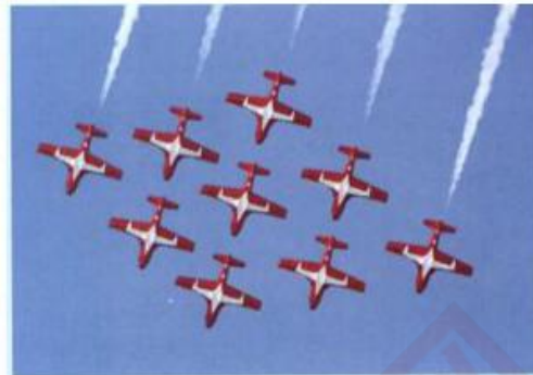
生活中的重复现象